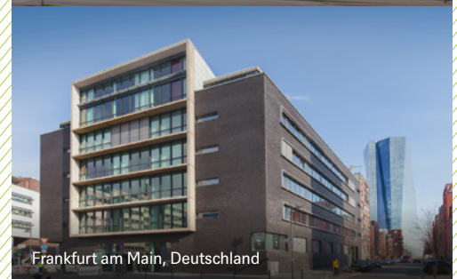
Frankfurt am Main, Deutschland